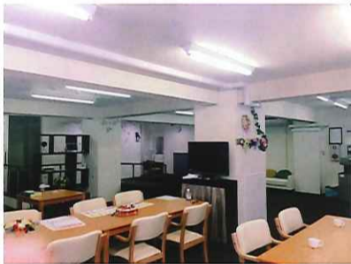
デイサービスここけあ練馬豊玉 ◎所在地/東京都練馬区豊玉北2丁目 鳳月第一ビル1F ◎事業内容/介護保険に関わる通所介護事業 (お問い合わせ) 03-6914-7334