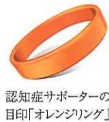
認知症サポーターの目印「オレンジリング」